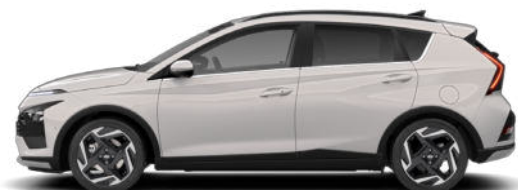
Lumen Gray Pearl Kontrastdach verfügbar