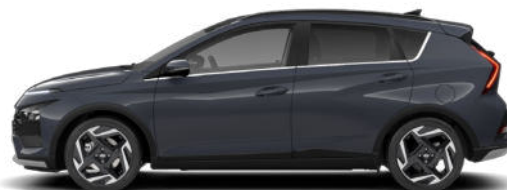
Aurora Gray Pearl