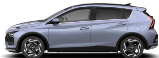
Meta Blue Pearl Kontrastdach verfügbar