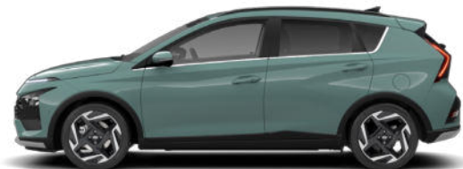
Mangrove Green Pearl Kontrastdach verfügbar