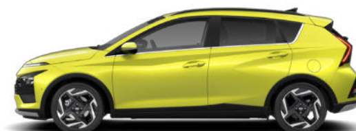
Lucid Lime Metallic Kontrastdach verfügbar