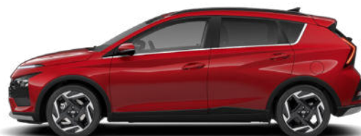
Dragon Red Pearl Kontrastdach verfügbar