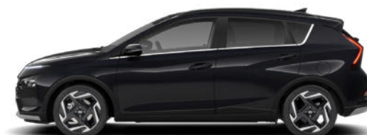
Phantom Black Pearl