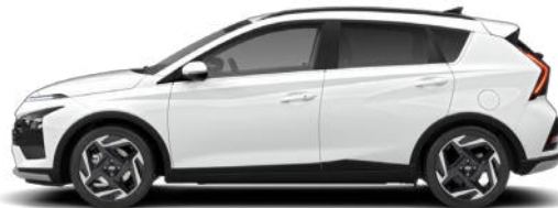
Atlas White Kontrastdach verfügbar