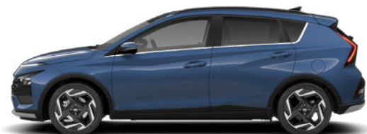
Vibrant Blue Pearl Kontrastdach verfügbar